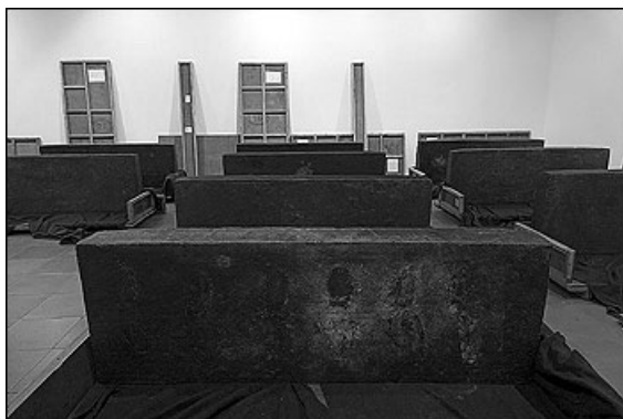
Lisson Gallery, 30 de noviembre 2007 - 18 de enero 2008

En la actualidad, acaba de exponer una obra en la Lisson Gallery de Londres, consistente en 21 monolitos compactos de caca seca, sanitizada, mezclada con fevicol (un aglutinante plástico), curada en moldes de madera aromática y convenientemente desodorizada para no ofender a la audiencia. Lo importante es que la materia prima de la obra ha sido recolectada a mano por mujeres de Nueva Delhi y Jaipur "cuya casta les impide tener otro trabajo que sacar la mierda de los baños públicos". Se trata de un montaje-denuncia que quiere hacer reflexionar sobre una historia particular