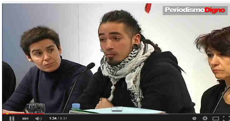
Rueda de prensa tras la repercusión de la emisión de "Ciutat Morta" en TV3 - PeriodismoDignoTV